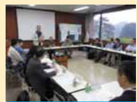
伊豆諸島連絡協議会 H19～