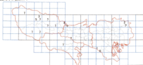
ある種の事例 1/25000地図を更に4分割し分布メッシュ化