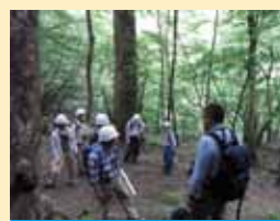
植物園間の連携【種子採集】 H20～