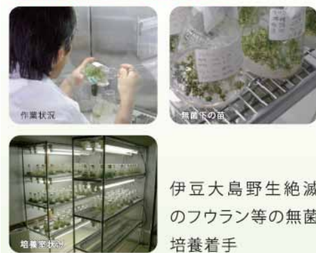
伊豆大島野生絶滅のフウラン等の無菌培養着手

査研究、それぞれ3つの柱をバランス良く実施するための施設整備や既存施設の有効活用を進めています。次にセンターにおいて行う事項について計画内容を整理し示します。