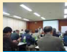
本土部（40 団体）協議会 H19～